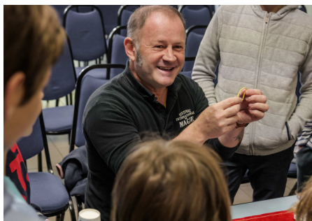
Ateliers de magie pour enfants animés par Stobineler